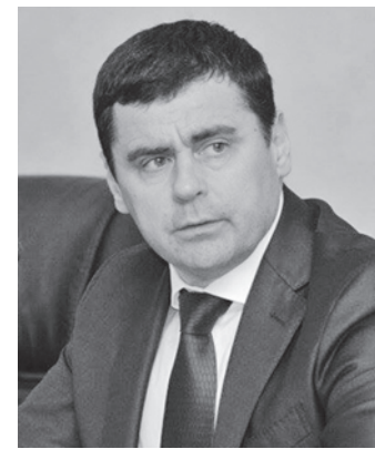
Дмитрий МИРОНОВ, Губернатор Ярославской области:

Всего в этом году Ярославской области будет выделено более 250 миллионов рублей из резервного фонда Президента России.